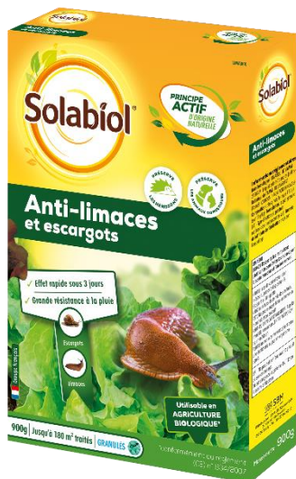
Etui 900 g