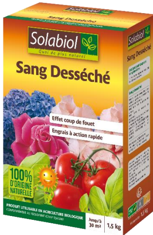
Etui 1,5 Kg