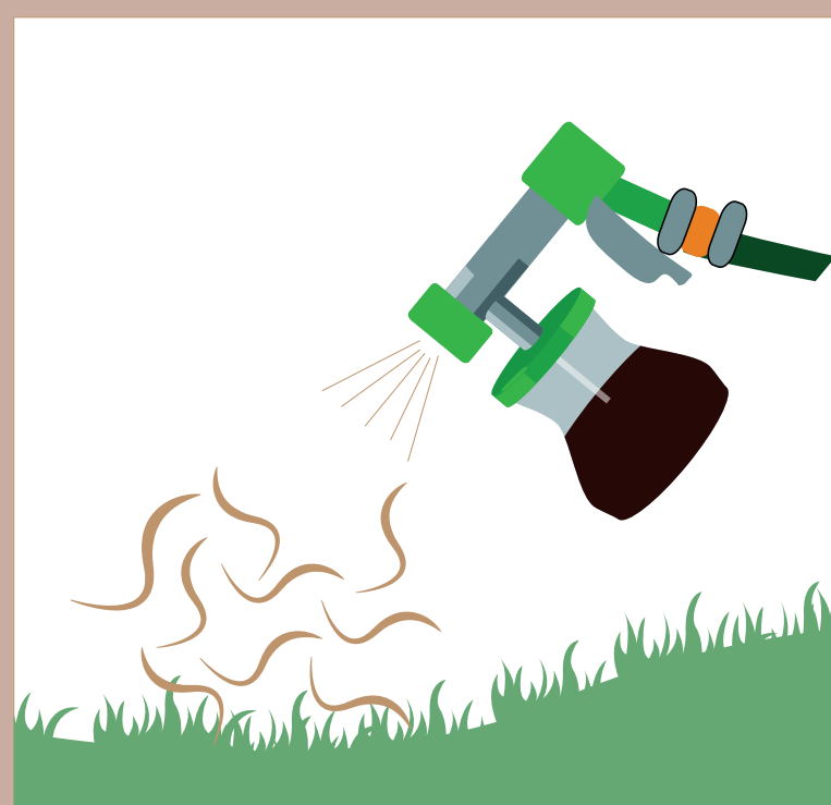
Nématodes auxiliaires : Parasitent les larves d'insectes