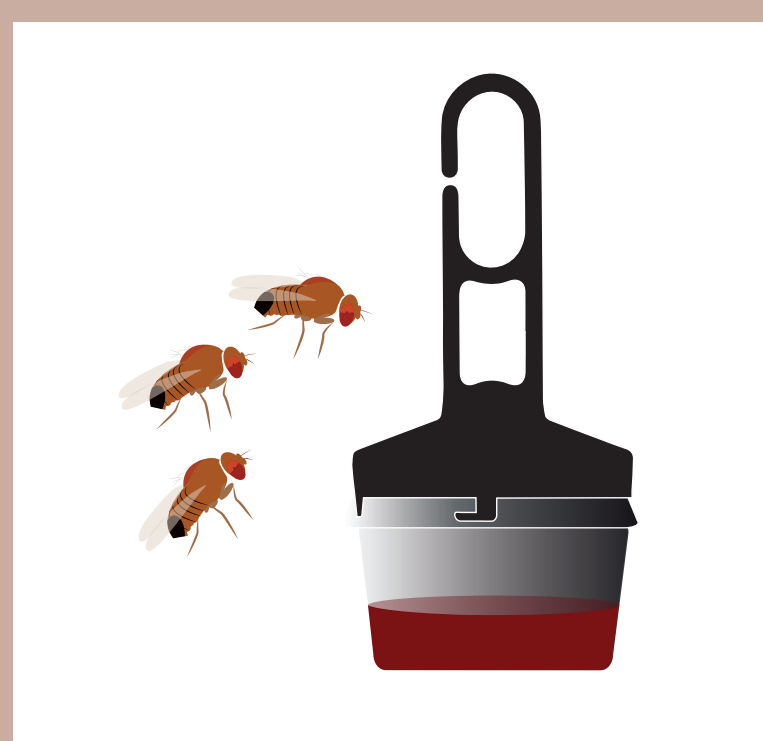
Liquide attractif: Attraction par l'odeur